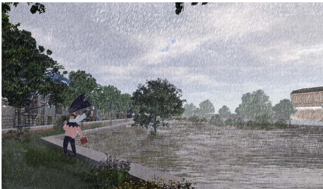
2 kade bij overstroming