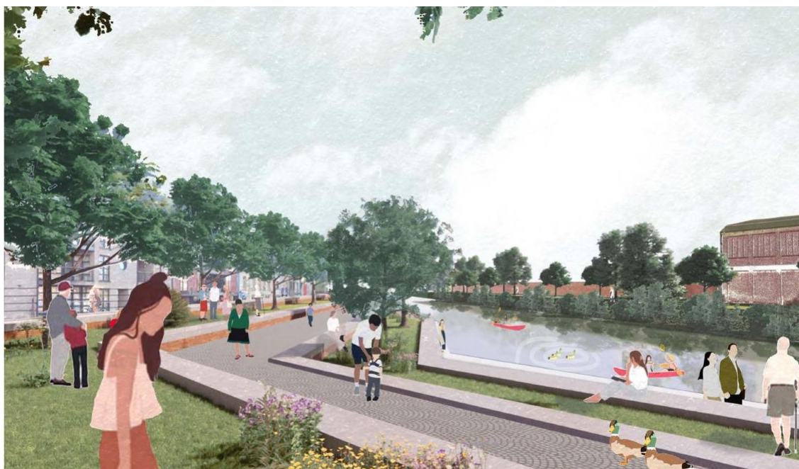
1 verhoogde kade